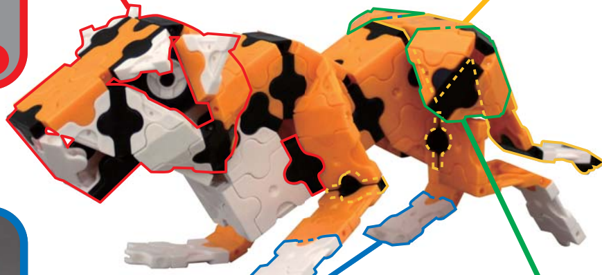
アニマルワールド タイガー